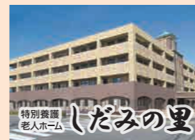
特別養護老人ホーム しだみの里 名古屋市守山区上志段味東谷2074-3 TEL 052-739-1155