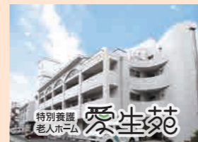
特別養護老人ホーム 愛生苑 名古屋市北区五反田町108-2 TEL 052-901-7621

法人事務局 〒462-0025 名古屋市北区鳩岡町1-7-20 TEL 052-916-3759 FAX 052-916-3764 jimukyoku@aiseifukusikai.jp