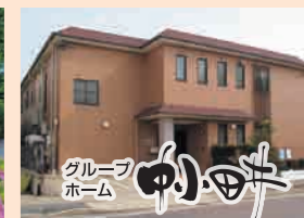
グループホーム 中井 名古屋市西区中小田井5-240 TEL 052-509-7717