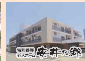
特別養護老人ホーム 安井の郷 名古屋市北区安井1-10-10 TEL 052-981-4165