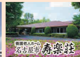
養護老人ホーム 名古屋市 寿楽荘 名古屋市守山区桜坂5-114 TEL 052-736-2368