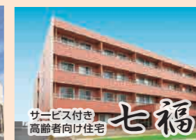
名古屋市北区中味鏡2-207 TEL 052-903-0729