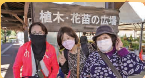
植木・花苗の広場

やっと皆で外出できるようになりました。各施設で紅葉狩りや食欲の秋を満喫してきました。