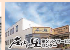
名古屋市西区中小田井3-389 TEL 052-504-3301