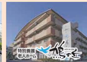
特別養護老人ホーム 龍ヶ崎 名古屋市北区鳩岡町1-7-20 TEL 052-916-3755