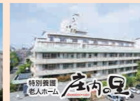
特別養護老人ホーム 庄内里 名古屋市西区中小田井2-98 TEL 052-505-1165