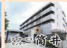
名古屋市東区筒井1丁目2-1-1 TEL 052-938-0065