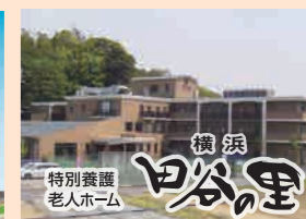
特別養護老人ホーム 橋本 神奈川県横浜市栄区田谷町1364-2 TEL 045-852-0012