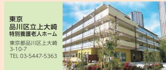
東京 品川区立上大崎 特別養護老人ホーム 東京都品川区上大崎 3-10-7 TEL 03-5447-5363