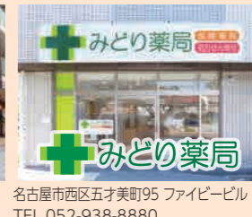
名古屋市西区五才美町95 ファイビービル 1F TEL 052-938-8880