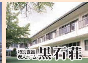
特別養護老人ホーム 黒石荘 名古屋市緑区黒沢台5-211 TEL 052-876-2611