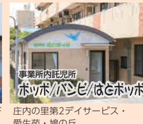
事業所内託児所 ぽっぽぱんぱんはとぽっぽ 庄内里 第2 デイサービス・愛生苑・鳩の丘