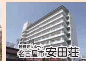
軽費老人ホーム 安田荘 名古屋市昭和区安田通2-4-2 TEL 052-762-1638