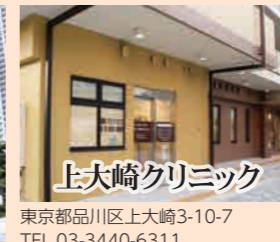
東京都品川区上大崎3-10-7 TEL 03-3440-6311