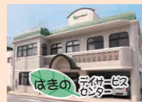
名古屋市北区秋野通1-26-1 TEL 052-916-5758