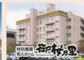
特別養護老人ホーム 御椀 愛知県丹羽郡大口町下小口6-124-2 TEL 0587-95-8151