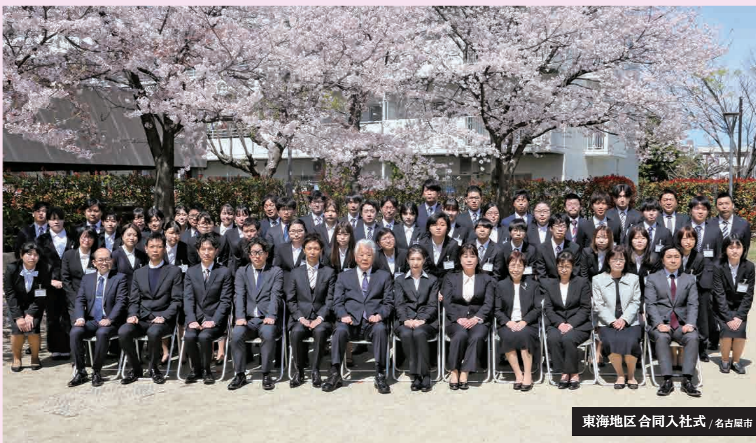
東海地区合同入社式 / 名古屋市

愛生福祉会 人財開発プロジェクト Human resource development project