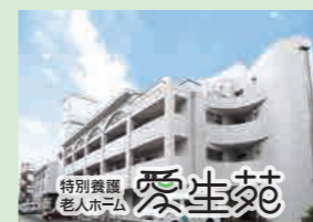
特別養護 老人ホーム 愛生苑 名古屋市北区五反田町108-2 TEL 052-901-7621

〒462-0025 名古屋市北区鳩岡町1-7-20 TEL 052-916-3759 FAX 052-916-3764 jimukyoku@aiseifukusikai.jp