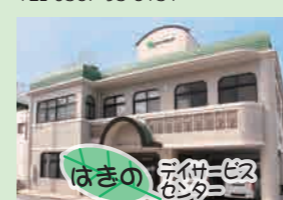
はきの 足付サービス センター 名古屋市北区萩野通1-26-1 TEL 052-916-5758