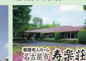
養護老人ホーム 名古屋市寿楽荘 名古屋市守山区下志段味長廻町2280-12 TEL 052-736-2368