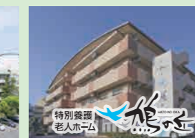
特別養護 老人ホーム 熊心 名古屋市北区鳩岡町1-7-20 TEL 052-916-3755