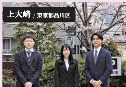
上大崎 / 東京都品川区