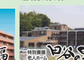
特別養護 老人ホーム 田谷の里 神奈川県横浜市栄区田谷町1364-2 TEL 045-852-0012