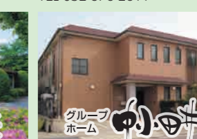
グループ ホーム うつのみや 名古屋市西区中小田井5-240 TEL 052-509-7717