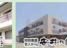
特別養護 老人ホーム 安井乃郷 名古屋市北区安井1-10-10 TEL 052-981-4165