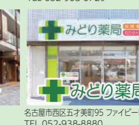
名古屋市西区五才美町95 ファイビービル 1F TEL 052-938-8880