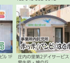
事業所内託児所 ホッポパズルはとホッポ 庄内の里第2デイサービス・ 愛生苑・鳩の丘