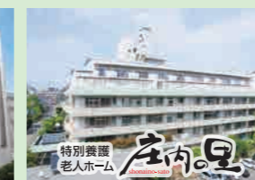
特別養護 老人ホーム 庄内里 名古屋市西区中小田井2-98 TEL 052-505-1165