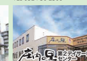
庄内里 第2デイサービス センター 名古屋市西区中小田井3-389 TEL 052-504-3301