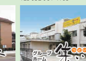
グループ ホーム 集 名古屋市守山区瀬古3-830 TEL 052-793-7004