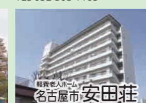
軽費老人ホーム 名古屋市安田荘 名古屋市昭和区安田通2-4-2 TEL 052-762-1638