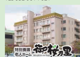
特別養護 老人ホーム 御桜乃里 愛知県丹羽郡大口町下小口6-124-2 TEL 0587-95-8151