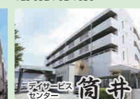
デイサービス センター 筒井 名古屋市東区筒井1丁目2-1-1 TEL 052-938-0065