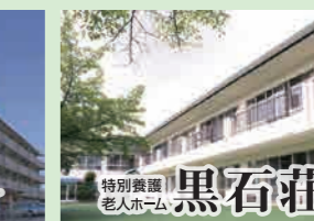
特別養護 老人ホーム 黒石荘 名古屋市緑区黒沢台5-211 TEL 052-876-2611