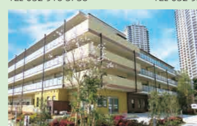
品川区立上大崎 特別養護 老人ホーム 東京都品川区上大崎 3-10-7 TEL 03-5447-5363