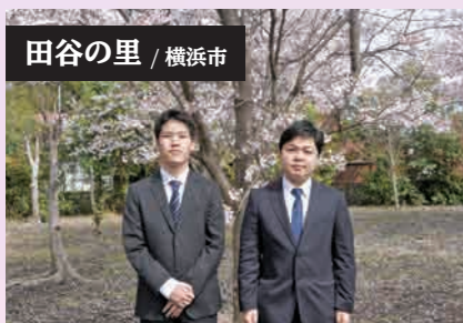
田谷の里 / 横浜市