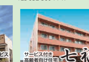
サービス付き 高齢者向け住宅 七福 名古屋市北区中味鏡2-207 TEL 052-903-0729