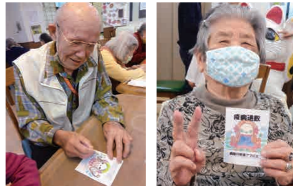
※アマビエ：疫病流行の時になんとかしてくれる親切的な妖怪。