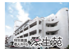
特別養護 老人ホーム 愛生苑 名古屋市北区五反田町108-2 TEL 052-901-7621

〒462-0025 名古屋市北区鳩岡町1-7-20 TEL 052-916-3759 FAX 052-916-3764 jimukyoku@aiseifukusikai.jp