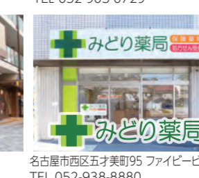
名古屋西區五才美町95 ファイビービル 1F TEL 052-938-8880