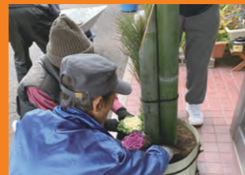
③竹を縄で縛り格好よく飾ります