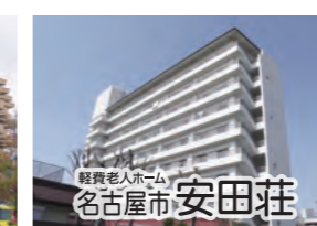
軽費老人ホーム 名古屋市安田荘 名古屋市昭和区安田通2-4-2 TEL 052-762-1638