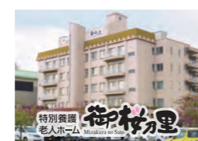
特別養護 老人ホーム 御椀 愛知県丹羽郡大口町下小口6-124-2 TEL 0587-95-8151