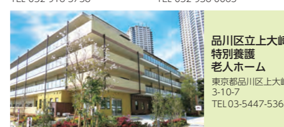
品川区立上大崎 特別養護 老人ホーム 東京都品川区上大崎 3-10-7 TEL 03-5447-5363