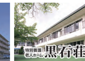
特別養護 老人ホーム 黒石荘 名古屋市緑区黒沢台5-211 TEL 052-876-2611