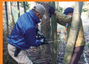
①孟宗竹を格好よく切り出します