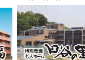
神奈川縣横浜市栄区田谷町1364-2 TEL 045-852-0012