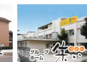
グループ ホーム 集い 名古屋市守山区瀬古3-830 TEL 052-793-7004