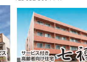
名古屋北區中味鏡2-207 TEL 052-903-0729