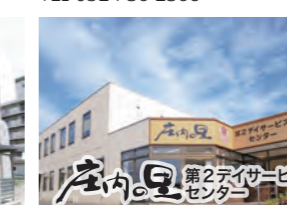
名古屋西區中小田井3-389 TEL 052-504-3301