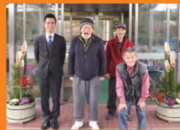
④今年も格好いい門松の出来上り