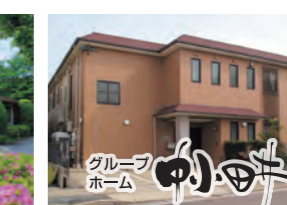
グループ ホーム うちわ 名古屋市西区中小田井5-240 TEL 052-509-7717