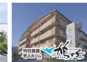
特別養護 老人ホーム 熊心 名古屋市北区鳩岡町1-7-20 TEL 052-916-3755