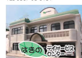
名古屋北區萩野通1-26-1 TEL 052-916-5758