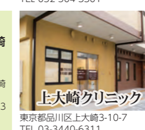
東京都品川区上大崎3-10-7 TEL 03-3440-6311