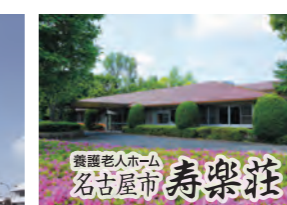
養護老人ホーム 名古屋市長寿楽荘 名古屋市守山区下志段味長廻間2280-12 TEL 052-736-2368