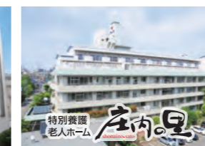
特別養護 老人ホーム 庄内 名古屋市西区中小田井2-98 TEL 052-505-1165