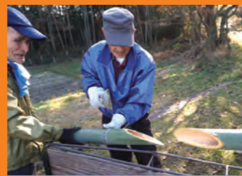
②格好いい角度でカットします