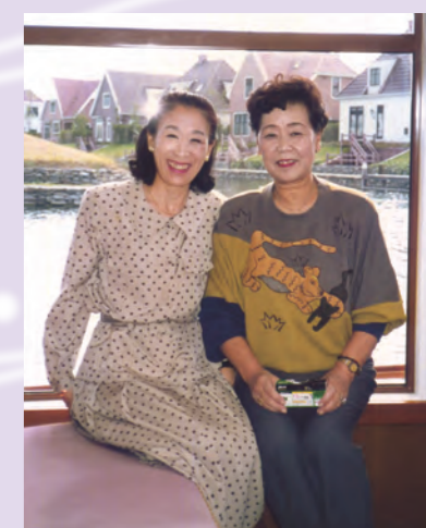
平成4年ハウステンボスにて