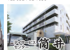
名古屋東區筒井1丁目2-1-1 TEL 052-938-0065