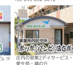
庄内の里第2デイサービス・ 愛生苑・鳩の丘