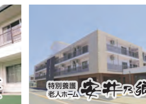
特別養護 老人ホーム 安井乃郷 名古屋市北区安井1-10-10 TEL 052-981-4165