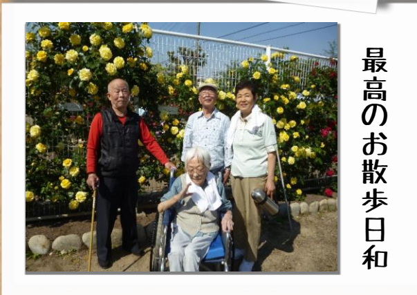
最高のお散歩日和