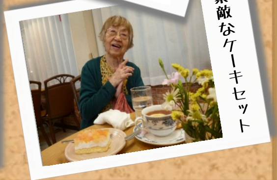
素敵なきーキセット