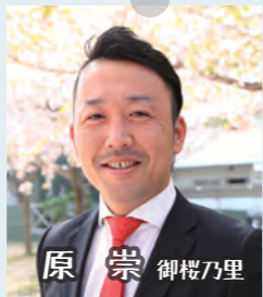
原 崇 御桜乃里 ブレない心