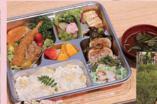
庄内の里 庄内緑地公園