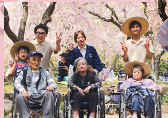
鳩の丘 庄内緑地公園