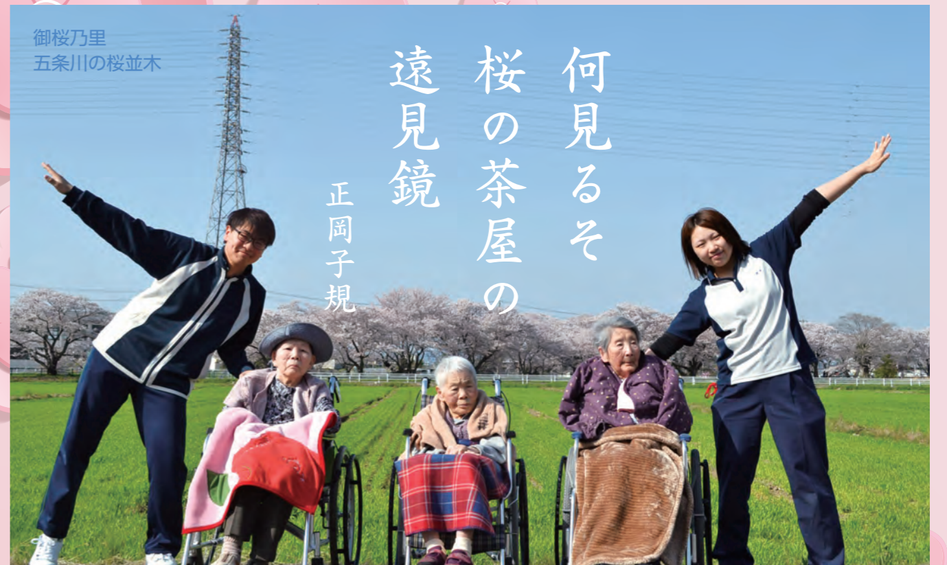
御桜乃里 五条川の桜並木