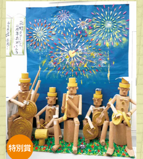
「祝 ドーンと響け! はぎの20周年」はぎのデイサービス