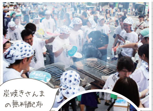
炭焼きさんまの無料配布

バブル期の土地価格高騰により、目黒駅周辺はビルだらけの冷たい町になってしまいました。危機感を覚えた『目黒駅前商店街振興組合青年部』が立ち上がり、昔ながらの目黒の温かさを呼び戻すため、平成8年から古典落語の『目黒のさんま』の話にちなみ、炭焼きさんまの無料配布が開始されました。第四回目から、さんまの有数の水揚げ港として有名な『宮古市』の賛同を得て、今年も7000匹もの新鮮なさんまの無償提供を受けご来場者に振る舞われる予定でしたが、今年は例年ないさんまの不漁で岩手県宮古市では水揚げが無く、北海道産のさんまで代用されました。さんまの炭火焼き会場からすぐ裏手に位置する「品川区立上大崎特別養護老人ホーム」さんま祭りでは地域の方へも開放し、少しずつ地元へ溶け込める施設になってきています。