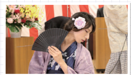
男性職員ですが、妙に色っぽい♪

平成29年9月15日、敬老会が開催されました。開設間もない施設ではありますが、そこは芸達者揃いの力を発揮し、仮装した職員が歌と踊りを交えたアトラクションを開催。ご利用者様達の笑顔が誘っていました。