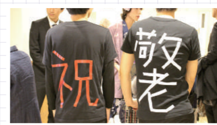
背中に文字を貼った手作りTシャツ♪