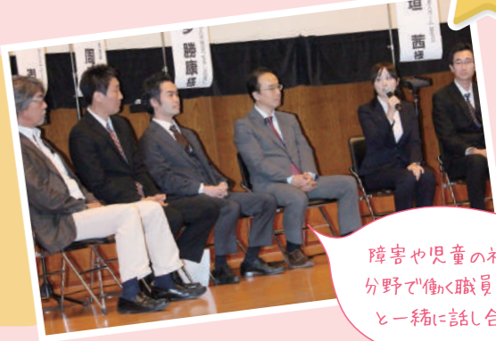
障害や児童の福祉分野で働く職員さんと一緒に話し合い

福祉現場等で働く若手職員が、これからの「福祉」がどのように輝いていくのかを考え、福祉現場を目指している方や福祉現場で働く仲間へ、熱いメッセージを送ります。