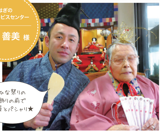
ひな祭りの飾りの前で職員とパシャリ★