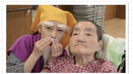
黄門様が隣に来ても落ち着き4つ...この黄門様！愛生福祉会のホームページのどこかで見かけた事ありますか？