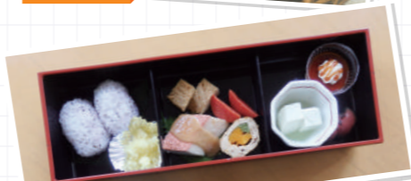
ゆかりおにぎり / 鶏肉の八幡巻き 茄子のフライ / 枝豆腐 / べったら漬け すいか / カップデザート