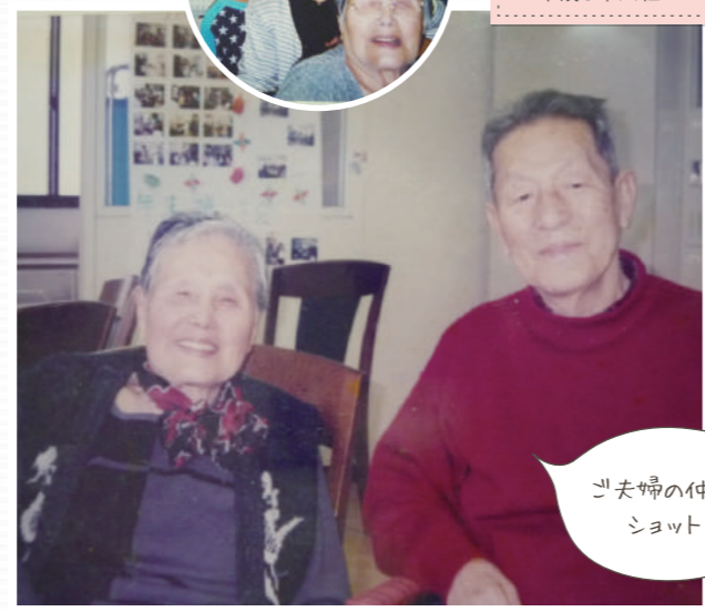
ご夫婦の仲よしショット！