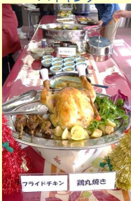
フライドチキン 鶏丸焼き