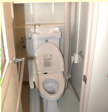
※ウォシュレット付洋式トイレです。