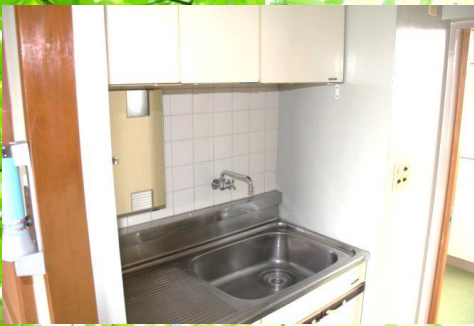
※シンクがございますが調理等、火を扱うものは全てご遠慮頂いています。電気ポットは置いて頂けます。