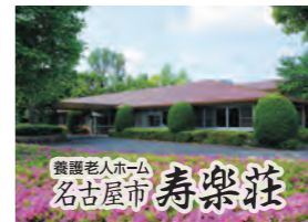
養護老人ホーム 名古屋市寿楽荘 名古屋市守山区下志段味長廻間2280-12 TEL 052-736-2368