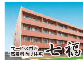
サービス付き高齢者向け住宅 七福 名古屋市北区中味鏡2-207 TEL 052-903-0729