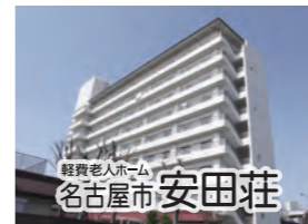
軽費老人ホーム 名古屋市安田荘 名古屋市昭和区安田通2-4-2 TEL 052-762-1638