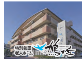
特別養護老人ホーム 雄心 名古屋市北区鳩岡町1-7-20 TEL 052-916-3755