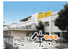
グループホーム 葵 名古屋市守山区瀬古3-830 TEL 052-793-7004