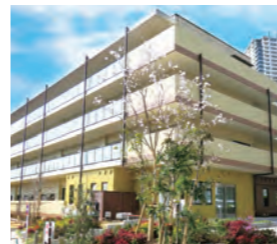
品川区立上大崎特別養護老人ホーム 東京都品川区上大崎3-10-7 TEL 03-5447-5363