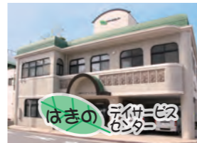
はぎのデイサービスセンター 名古屋市北区萩野通1-26-1 TEL 052-916-5758