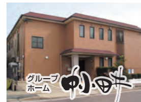
グループホーム 中つぼ 名古屋市西区中小田井5-240 TEL 052-509-7717