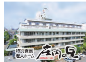
特別養護老人ホーム 庄内里 名古屋市西区中小田井2-98 TEL 052-505-1165