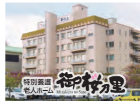
特別養護老人ホーム 御蔵里 愛知県丹羽郡大口町下小口6-124-2 TEL 0587-95-8151