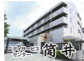
デイサービスセンター 簡井 名古屋市東区簡井1丁目2-1-1 TEL 052-938-0065