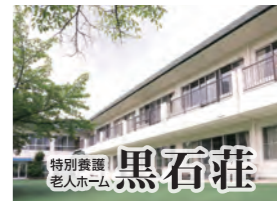
特別養護老人ホーム 黒石荘 名古屋市緑区黒沢台5-211 TEL 052-876-2611