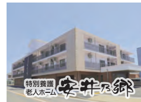
特別養護老人ホーム 安井乃郷 名古屋市北区安井1-10-10 TEL 052-981-4165