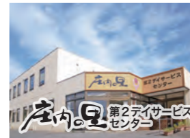
庄内里 第2デイサービスセンター 名古屋市西区中小田井3-389 TEL 052-504-3301