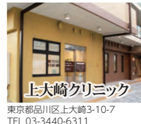
上大崎クリニック 東京都品川区上大崎3-10-7 TEL 03-3440-6311