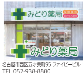
みどり薬局 名古屋市西区五才美町95 ファイビービル 1F TEL 052-938-8880