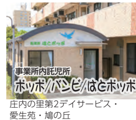
事業所内託児所 ホッポパパンとほほポポ 庄内里第2デイサービス・愛生苑・鳩の丘