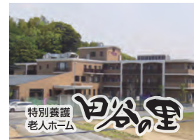
特別養護老人ホーム 葵の里 神奈川県横浜市栄区田谷町1364-2 TEL 045-852-0012