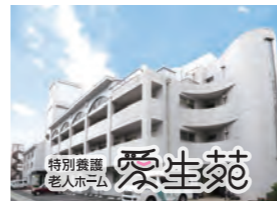
特別養護老人ホーム 愛生苑 名古屋市北区五反田町108-2 TEL 052-901-7621

〒462-0025 名古屋市北区鳩岡町1-7-20 TEL 052-916-3759 FAX 052-916-3764 jimukyoku@aiseifukusikai.jp