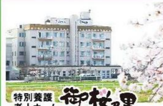
特別養護 老人ホーム 御蔵里 愛知県丹羽郡大口町下小口 6丁目124-2 TEL.0587-95-8151 FAX.0587-95-8680