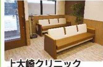
上大崎クリニック 東京都品川区上大崎3-10-7 TEL.03-3440-6311 FAX.03-3440-6312