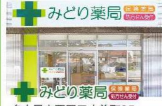
みどり薬局 名古屋店 名古屋市西区五才美町95 ファイブビル1階 TEL.052-938-8880 FAX.052-938-8865