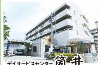
デイサービスセンター 筒井 名古屋市東区筒井1丁目2番 1-1号 TEL.052-938-0065 FAX.052-938-0070