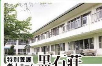
特別養護 老人ホーム 黒石荘 名古屋市緑区黒沢台5丁目 211番地 TEL.052-876-2611 FAX.052-877-6090