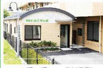
託児所 ボツポ 庄内の里第2 デイサービスセンター 託児所 ハンピ 愛生苑 託児所 ほとボツポ 鳩の丘