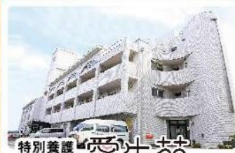
特別養護 老人ホーム 愛生苑 名古屋市北区五反田町108-2 TEL.052-901-7621 FAX.052-901-7911