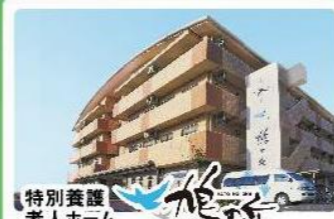
特別養護 老人ホーム 鶴の嶺 名古屋市北区鳩岡町1丁目 7番地20 TEL.052-916-3755 FAX.052-916-3756