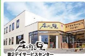
第2デイサービスセンター 庄内の岩 名古屋市西区中小田井3丁目 389番地 TEL.052-504-3301 FAX.052-504-3302