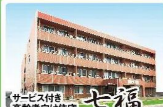
サービス付き 高齢者向け住宅 七福 名古屋市北区中味鏡2丁目 207番地 TEL.052-903-0729 FAX.052-903-0723