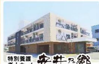
特別養護 老人ホーム 安井の郷 名古屋市北区安井1丁目 10番地10 TEL.052-981-4165 FAX.052-981-4167