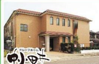
グループホーム 小七 名古屋市西区中小田井5丁目 240番地 TEL.052-509-7717 FAX.052-509-7727