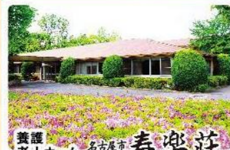
養護 老人ホーム 名古屋 寿楽荘 名古屋市守山区大字下志段味 字長廻間2280-12 TEL.052-736-2368 FAX.052-736-2529