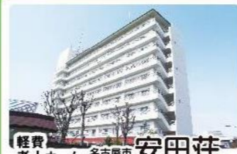
軽費 老人ホーム 安田荘 名古屋市昭和区安田通2丁目 4番地の2 TEL.052-762-1638 FAX.052-752-7292