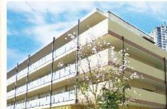
東京都 品川区立上大崎 特別養護 老人ホーム 東京都品川区上大崎 3-10-7 TEL.03-5447-5363 FAX.03-3440-6310