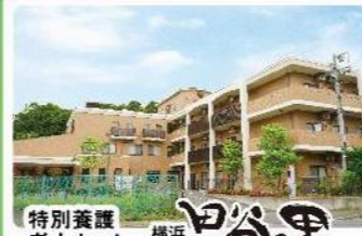
特別養護 老人ホーム 谷の里 神奈川県横浜市栄区田谷町 1364番地2 TEL.045-852-0012 FAX.045-827-3866