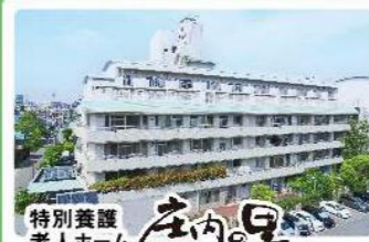
特別養護 老人ホーム 庄内の岩 名古屋市西区中小田井2丁目 98番地 TEL.052-505-1165 FAX.052-505-1161