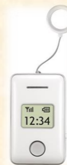
みまもりケータイ