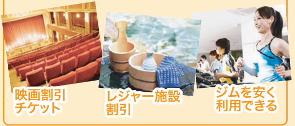
映画割引チケット レジャー施設割引 ジムを安く利用できる

格安でホテルに宿泊できる、映画やスポーツジム・飲食店が安く利用できる、育児支援が受けられるなどの多彩な福利厚生をご利用いただけます。正職員だけでなく、パートの方でもご利用いただけます。さらに、2016年4月に入職予定の内定者の皆さんも、ご利用いただけるようになりました！