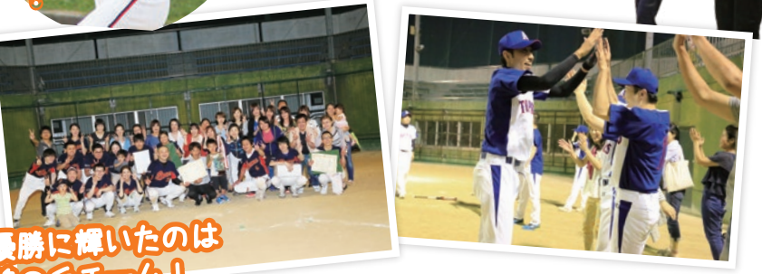
優勝に輝いたのは鳩の丘チーム！

5月30日、愛生福祉会恒例のソフトボール大会が開催されました。田谷の里の職員も横浜から訪れ、大規模な大会になりました。優勝は鳩の丘チーム。なんと前年に続き2冠達成！おめでとうございます。