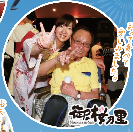
踊って食べて楽しみました!