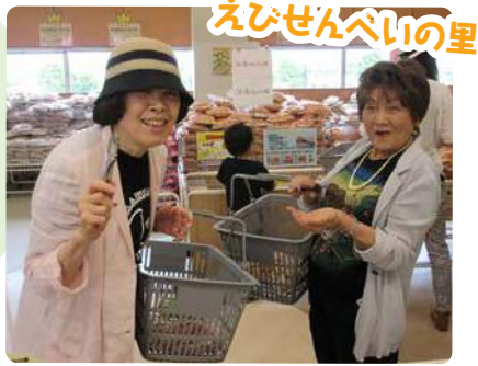
えびせんべいの里

えびせんべいの里に行きました♪ソフトクリームを食べたりえびせんべいを試食されたりと楽しんでいらっしゃいました。