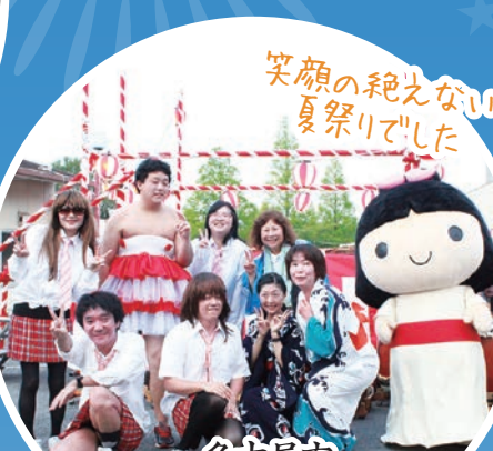
笑顔の絶えない夏祭りでした