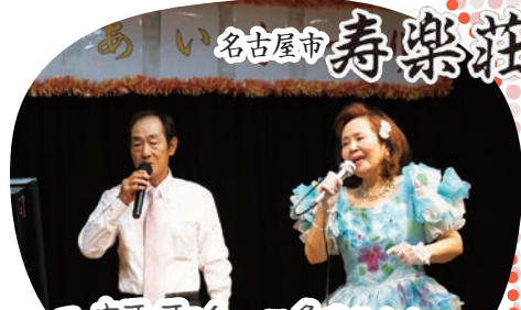
元演歌歌手の三条まりさんにお越しいただきました!ご利用者様とデュエット♪