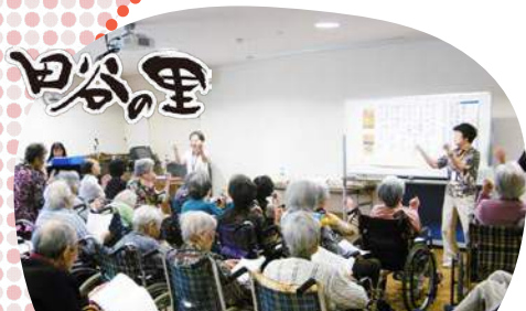
「歌の会」を開催しました。声を出してみんなで合唱♪