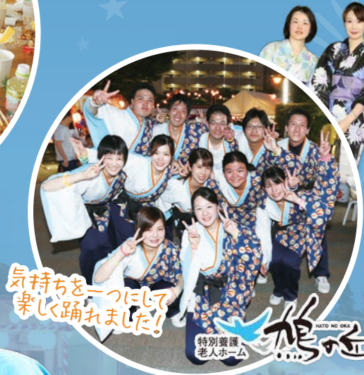
気持ちを一つにして楽しく踊りました!

ご家族様・近隣の方々にもお越しいただき、とても楽しい夏祭りになりました! 皆様、ご参加ありがとうございました。