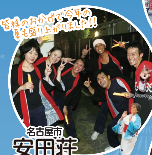
皆様のおかげで今年の夏も盛り上がりました!!