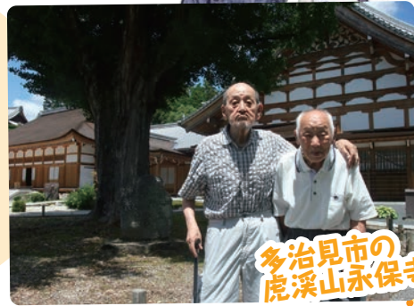
多治見市の虎溪山永保寺

虎溪山永保寺に行きました。当日はお天気に恵まれ、庭園を散歩しながら観音堂をととても熱心にご覧になられていました。