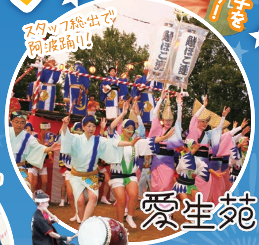
スタッフ総出でアヲ波踊り!

各施設にて夏祭りを開催いたしました! 毎年、楽しみにして下さっているご利用者様も多いこのイベント。今年も昨年以上の盛り上がりを見せ、花火や盆踊り、出店でのお食事を皆様思い思いに楽しんでいらっしゃいました。