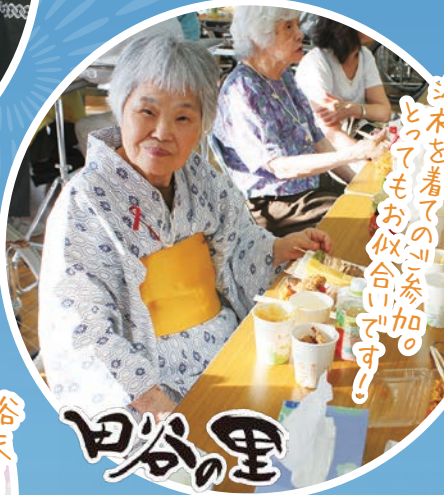
浴衣を着ての川参加のつもりもお似合いです!