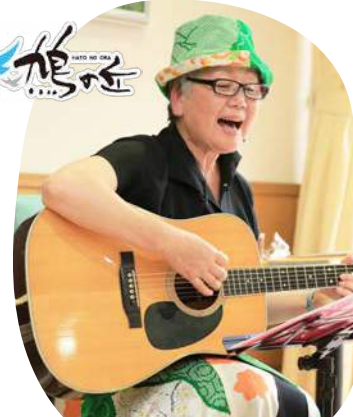
唄のボランティアの懐かしい歌をみんなで歌うと楽しいですね!