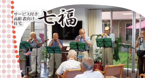
北ハーモニックカラオケの皆様の演奏を楽しみました!