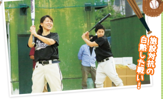
施設対抗の白熱した戦い！

5月30日、愛生福祉会恒例のソフトボール大会が開催されました。田谷の里の職員も横浜から訪れ、大規模な大会になりました。優勝は鳩の丘チーム。なんと前年に続き2冠達成！おめでとうございます。